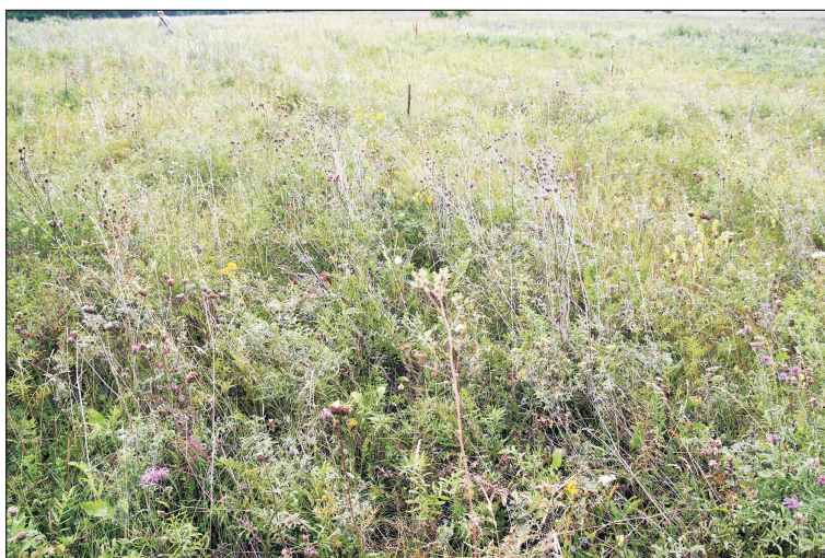
Рис. 3. Старый отвал с ПСП. Луговой (травянистый) тип сукцессии.