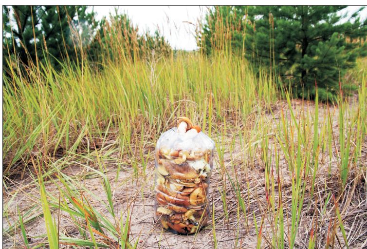
Рис. 4. Урожай шляпочных грибов, собранных в течение 15 мин на отвалах после лесной рекультивации (создания культур сосны).