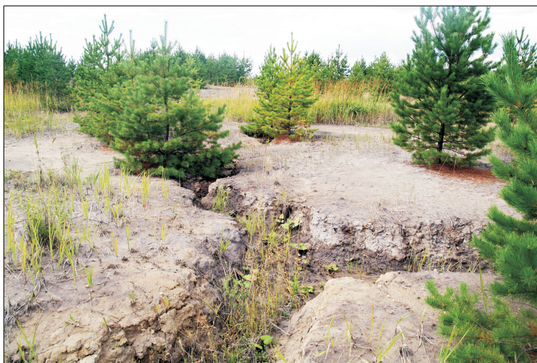
Рис. 2. Мелкоовражная эрозия на отвалах без ПСП, спровоцированная механической посадкой сосны в борозды вдоль склона.